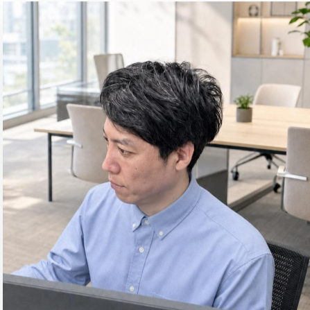
株式会社MOCA / COACH